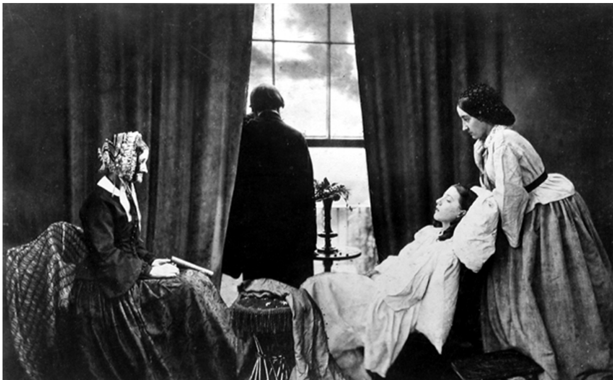
Abb. 2 HENRY PEACH ROBINSON: Fading Away , 1858. Fotocollage. Albuminabzug von fünf Negativen. The Royal Photographic Society, Bath, England.

Die Fotoinszenierung und Fotomontage mit dem Titel Fading Away des Engländers HENRY PEACH ROBINSON aus dem Jahr 1858 kann als frühes Beispiel für diese Bildart gelten ( Abb. 2 ). Voraussetzung für deren Akzeptanz war jedoch ein gesellschaftlicher Konsens, eine kulturelle Übereinkunft, dass Fotos auch als symbolische Zeichen wirken könnten. Das war Neuland, und es bedeutete eine erhebliche Erweiterung der fotografischen Aussagemöglichkeiten in Richtung auf das, was heute allgemein mit dem Begriff ‚Medium Fotografie‘ bezeichnet wird: eine stellungnehmende, kommentierende, Werte und Überzeugungen vermittelnde Funktion, die Fotos heute unbestritten erfüllen. Sie erreichten damit neue Dimensionen: Subjektivität, Poesie, Stil (KAUFHOLD 1986).