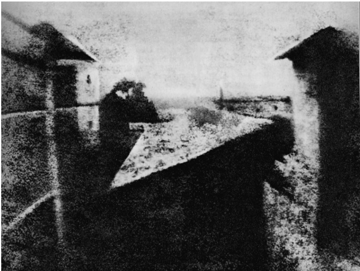
Abb. 1 NICÉPHORE NIÈPCE: Blick aus dem Fenster, 1826. Erste Fotografie nach der Natur.