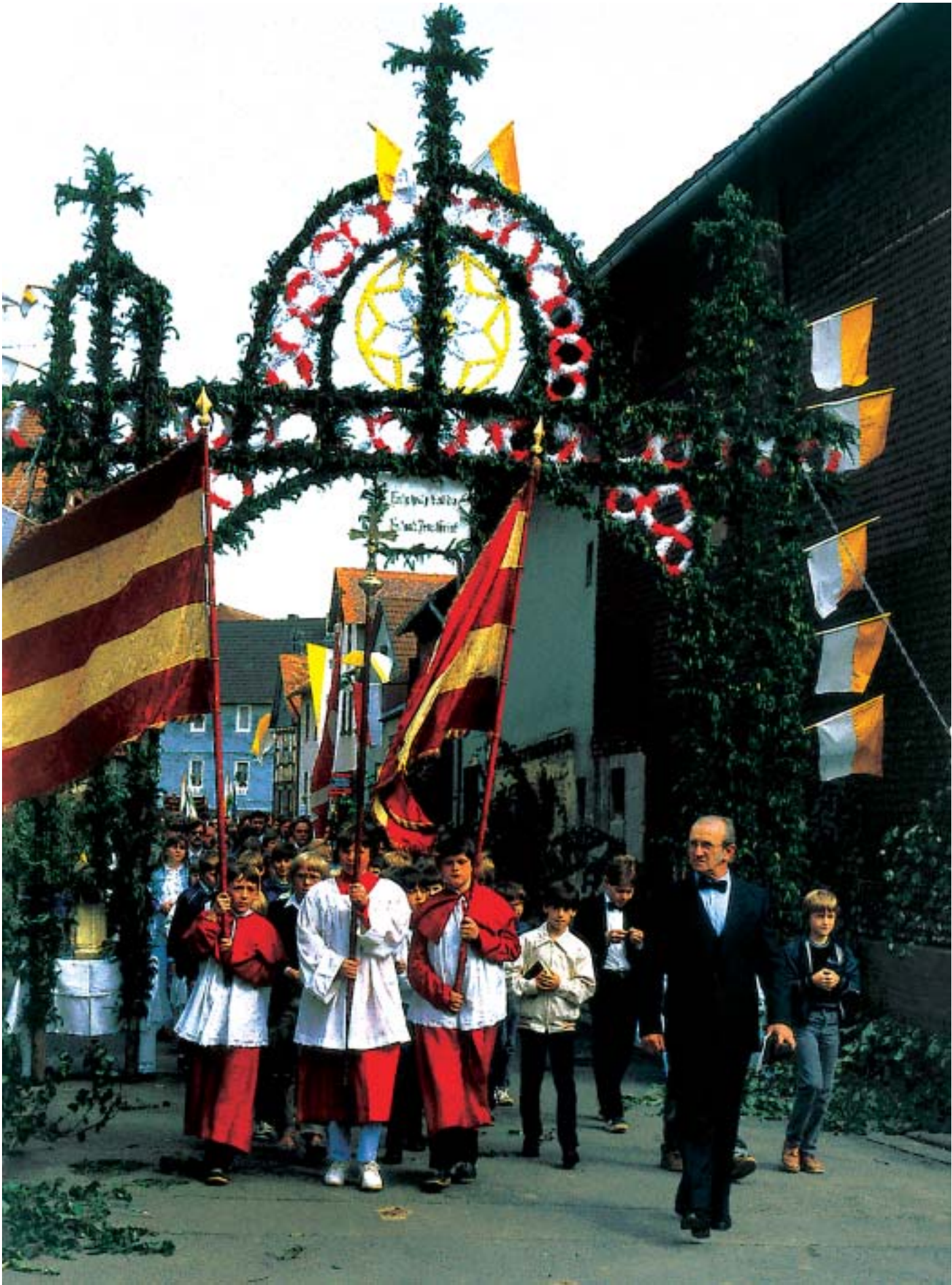
Linke Seite (unten) und hier: Christliche Ehrenpforten für den eucharistischen Heiland im katholischen Mardorf in Hessen, nur für die Fronleichnamsprozession errichtet.