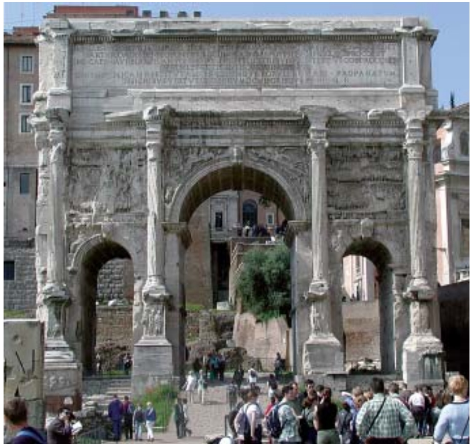
Rom: Triumphbogen des Septimus Severus im Forum Romanum, Richtung Kapitol.

dreitorigen Anlagen mit erhöhtem Mittelteil bestand wohl darin, daß die zu würdigende Person durch das erhöhte Mittelportal schritt, ritt oder (beispielsweise bei pompösen Begräbnissen) geführt wurde, während die beiden kleineren Seitenportale für deren Begleitung oder das Volk bestimmt waren. In seiner Theorie der Triumphbögen bemerkt dementsprechend Leon Battista Alberti, Verfasser einer auf lange Zeit maßgeblichen Sammlung