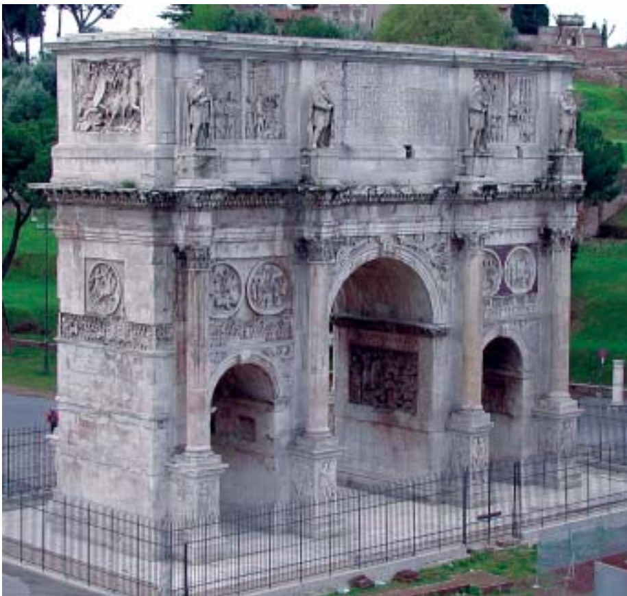
Rom: Triumphbogen des Kaisers Konstantin, neben dem Kolosseum, errichtet 315 zur Verherrlichung des Sieges über Maxentius, vermutlich unter Einbeziehung eines älteren Triumphbogens für Kaiser Hadrian.

Das antike Rom hinterließ jedenfalls drei Beispiele der ersten Art: den Titusbogen, den Bogen des Septimus Severus und den Konstantinsbogen. Sie weisen alle drei die gleiche Form auf: Denn sie bestehen aus einem sehr großen und hohen, aus steinernen Quadern gebauten Portal, zu dessen beiden Seiten sich noch zwei kleinere Portale befinden oder doch zumindest (im Falle des Titusbogens) einmal befunden haben dürften. Die Hauptseiten sind vorne und hinten mit Säulen verziert, die ein vollständiges Gebälk mit darübergesetzter Attika tragen. Über den Bogen und auf dem Fries des Gebildes findet man, in Stein gehauen, die Abbildung derjenigen Taten oder Geschehnisse, durch die das jeweilige Denkmal veranlaßt wurde.