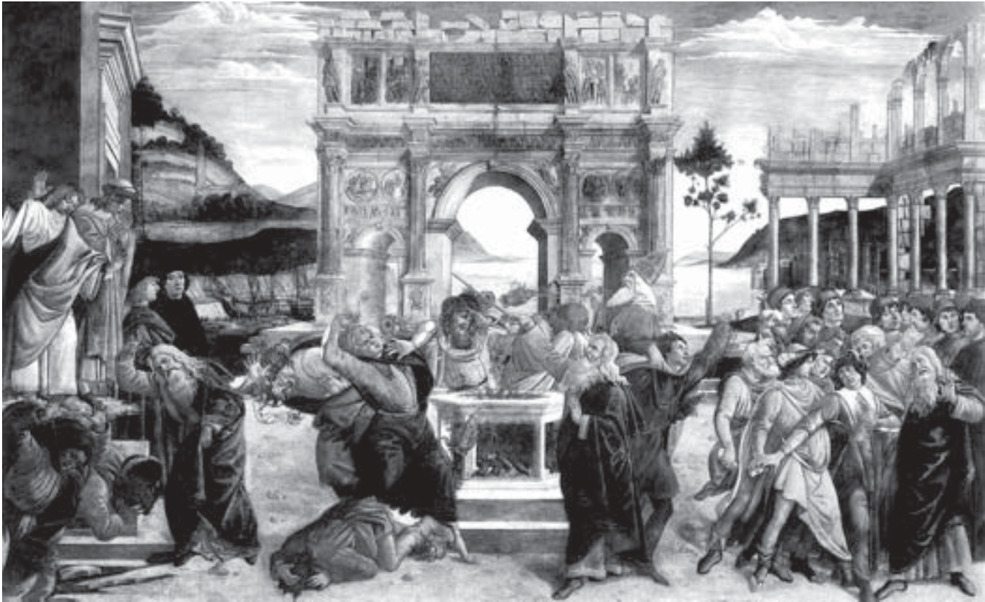
Sandro Botticelli: »Die Rote Korah« oder »Der Aufruhr gegen das Gesetz Moses«, 1481-1482.