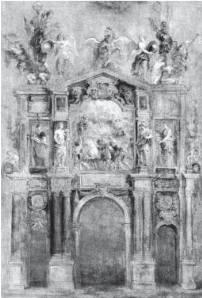
Peter Paul Rubens: Skizze zur Ehrenpforte für den Kardinalinfanten Ferdinand (Rückseite), Antwerpen 1635. St. Petersburg: Eremitage.

pforten (»Triumphbögen«) zur Fronleichnamsprozession ist übrigens auch für die katholische Schweiz bezeugt. 46