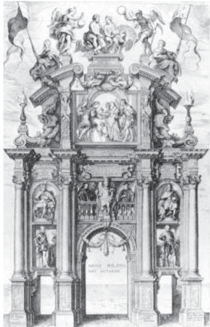
Theodor van Thulden: Die Ehrenpforte Philipps IV., errichtet zu Ehren des Kardinalinfanten Ferdinand von Österreich 1635 in Antwerpen.