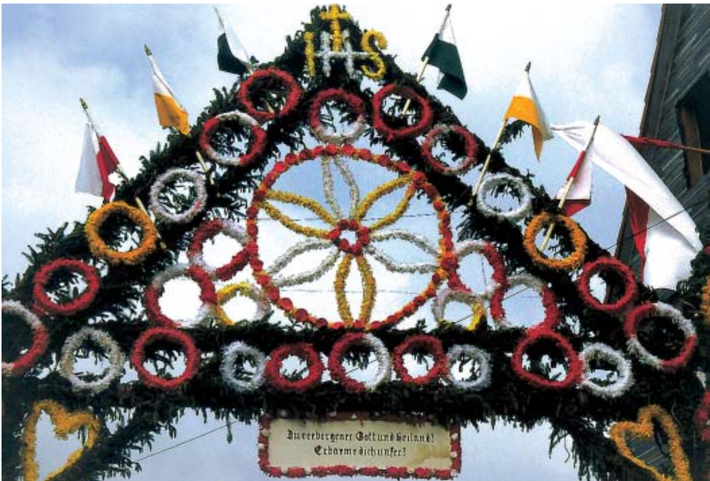
Christliche Ehrenpforten, oben für eine Jungfrau, die das Gelübde der Ehelosigkeit getan hat. Die der evangelischen Kirche angehörende »Rheinische Mission« wirkte zeitweise auch in China (in und um Hongkong).