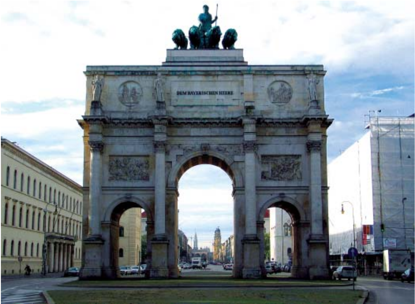
Das Siegestor in München, Zustand von 2004, mit Blick auf die Ludwigstraße und die Feldherrnhalle.